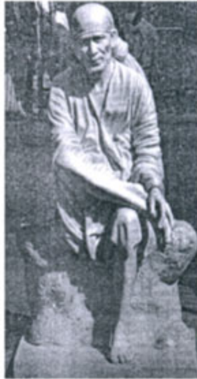
संगमरवर नव्हे फायबर मेडियात साकारलेले साईबाबा