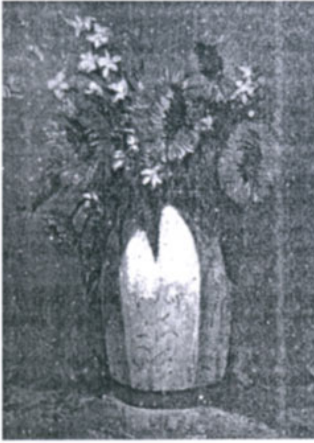
स्टील लाईफ : मिक्स मेडिया