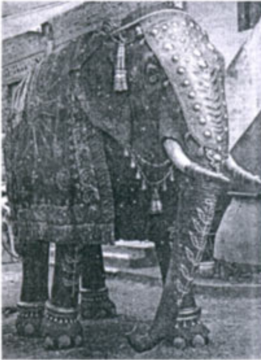
सूक्ष्म निरीक्षण : डौलदार ऐरावत!

म्हणायचे. परंतु प्रमोदने असे केले नाही. नगरला गरीब कलाशिक्षकाच्या घरी जन्मला. बालपणापासून हरहुत्ररी ठरला. माक्समिमोपेक्षा कॅनव्हास आणि मातीमध्ये रमला. पुढे मुंबईला गेला 'जे.जे.'त सुवर्णपदक मिळविले, बाँम्बे आर्ट सोसायटीच्या पुरस्काराचा मानकरी झाला. एक रुपये तासापासून शंभर रुपये तासापर्यंत विस्तारला. मुंबई-पुणे-समर्थ आर्ट सर्किस-फिल्म लाईन अशी भ्रमंती करून पैसाही मिळवला परंतु गावच्या 'सिना' नदीच्या मातीचा कुंभारगल्लीतील स्पर्श केवळ हातापुरता नव्हता तर मनाच्या, प्रतिभेच्या भूमीला झाला होता. त्यामुळे सारे